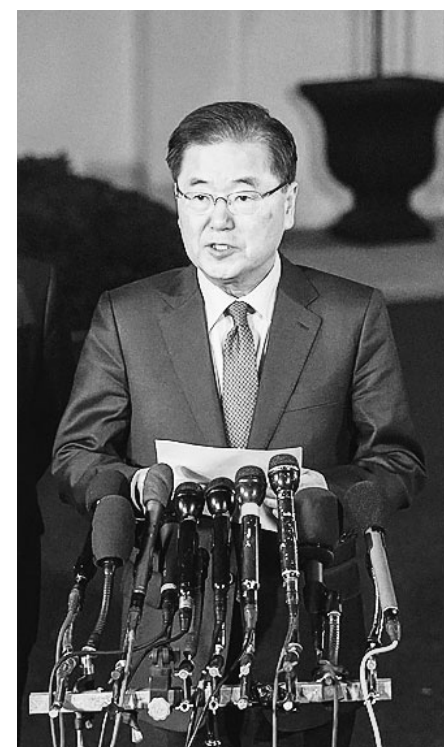
South Korean National Security Advisor Chung Eui-Yong (right) briefs reporters after meeting with Donald Trump

He said it was the strongest indication to date of Kim's "not just willingness but really his desire for talks".