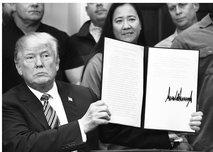
President Donald Trump holds up a proclamation on aluminium in the White House on Thursday

The president has invited "any country with which we have a security relationship" to discuss "alternative ways" to address the security risks of steel and aluminium imports, a process that could lead to other countries being excluded, according to official proclamations Trump signed at the White House. Trump said his top trade negotiator, Robert Lighthizer, will be in charge of working out deals with other countries on possible exemptions. Trump has also given Commerce Secretary Wilbur Ross