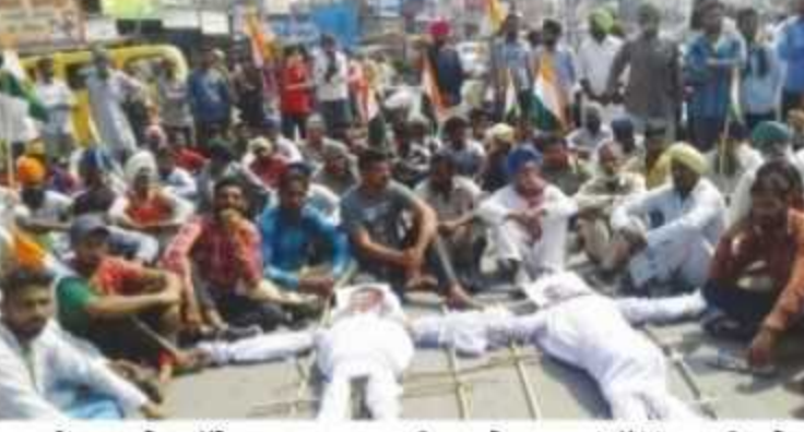
ਪੰਜਾਬ ਪ੍ਰਦੇਸ਼ ਪੱਲੇਦਾਰਾ ਮਜਦੂਰ ਯੂਨੀਅਨ ਦੇ ਵਰਕਰਾਂ ਵੱਲੋਂ ਅਰਥੀ ਫੂਕ ਜਾਣ ਸਮੇਂ ਦਾ ਦ੍ਰਿਸ਼।